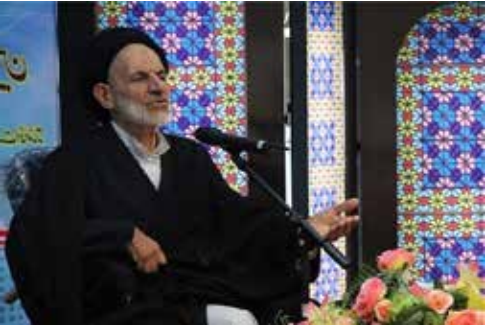
عنوان امری واجب در سطح ادارات و سازمانها مورد توجه قرار گیرد.