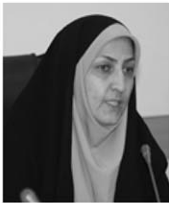
و همدلی کلیه مسئولین استانی، شهرستانی و منطقه ای را به عمل می طلبد.

دوره متوسطه اول به صورت تیم حامی قهرمان به مسابقات کشوری اعزام شده اند. راندیا تصریح کرد: استعدادیابی و استعدادشناسی ورزشی و تمرینات برنامه ریزی شده براساس اصول علمی توسط مربیان مجرب از فاکتورهای مهم در موفقیت یک ورزشکار می باشد و آنچه که در آموزش و پرورش مهم است حضور فعال آموزگاران و دبیران صاحب علم و عمل است تا استعدادیابی را در مدرسه و کلاس درس داشته باشند و مستعدین را به کانون های ورزشی درون و برون مدرسه ای هدایت نمایند. وی تاکید کرد: مسلم است برای گسترش و شکوفایی ورزش دانش آموزی که زیربنای ورزش استان است همراهی، همکاری