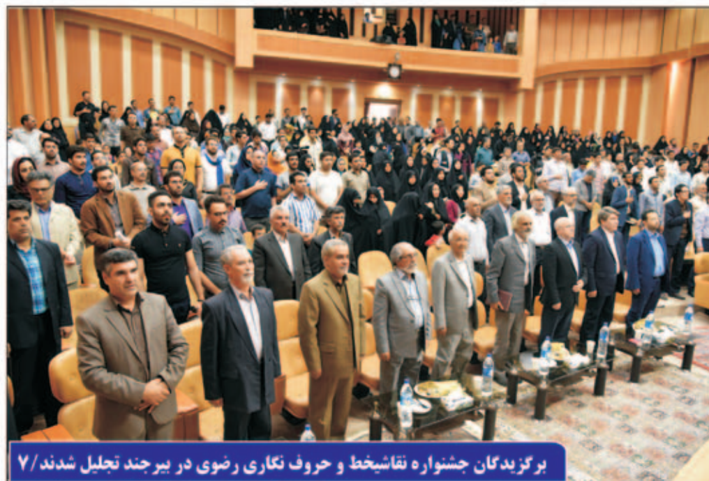
برگزیدگان جشنواره نقاشیخط و حروف نگاری رضوی در بیرجند تجلیل شدند/۷