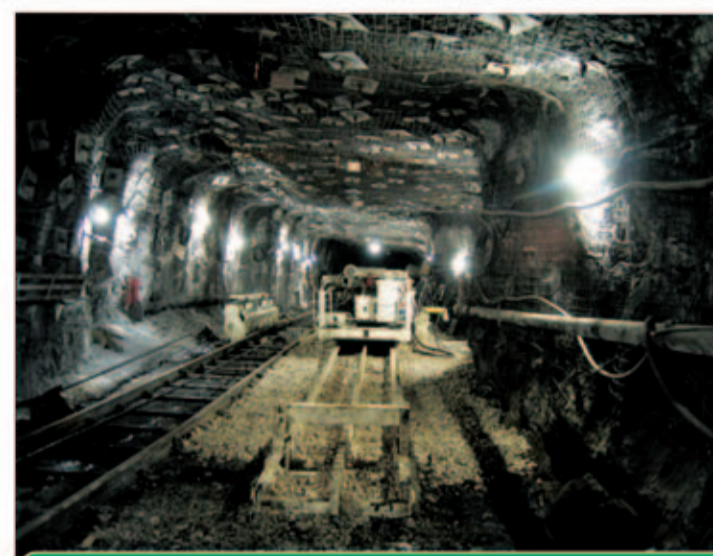
باز هم بیکاری کارگران؛ این بار کارگران معادن طبس ۲/