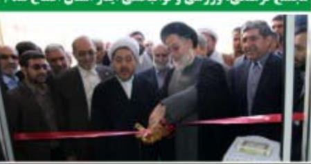
مجمع فرهنگی، ورزشی و توبیختی انبار استان افتتاح شد/۳