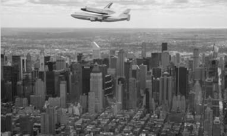
پرواز شاتل فضایی بر فراز آسمان نیویورک