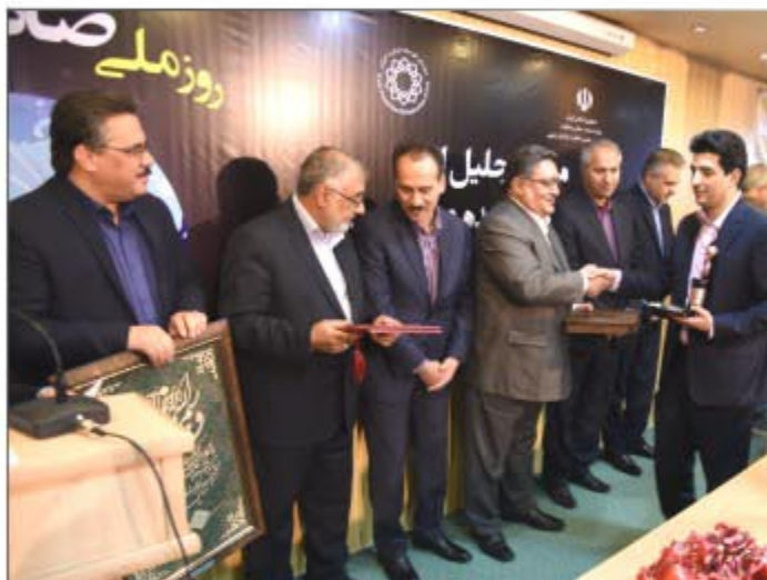
صنایع کاشی فرزاد و سرامیک یلدا صادر کننده برتر در استان شد/۸