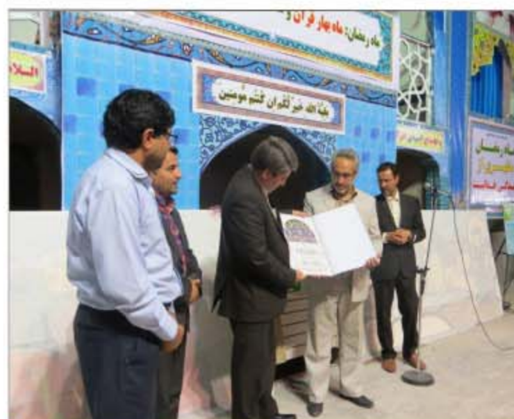
رونمایی از چهار اثر هنری در دهمین نمایشگاه بزرگ قرآن کریم خراسان جنوبی/۳

در شورای برنامه ریزی و توسعه استان اعلام شد