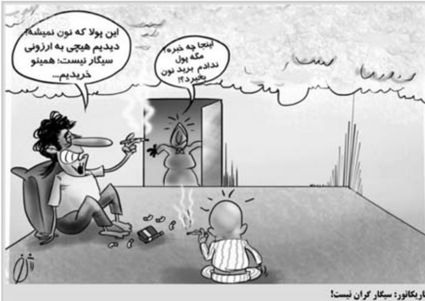
کاریکاتور: سیگار گران نیست!

سرمربی تیم ملی فوتبال کشورمان گفت: با توجه به اینکه قرار بود تیم ملی مورد حمایت مسئولان قرار بگیرد اما گویا این امر تاکنون محقق نشده است و شرایط به گونه ای است که دوست دارم دست به خودکشی بزنم.به گزارش باشگاه خبرنگاران، کارلوس کیروش اظهار داشت: به طور حتم جام جهانی از امروز برای ما آغاز خواهد شد و ما در دو مرحله اردوها را بسر گزار کردیم و از هر لحاظ علی الخصوص فنی از