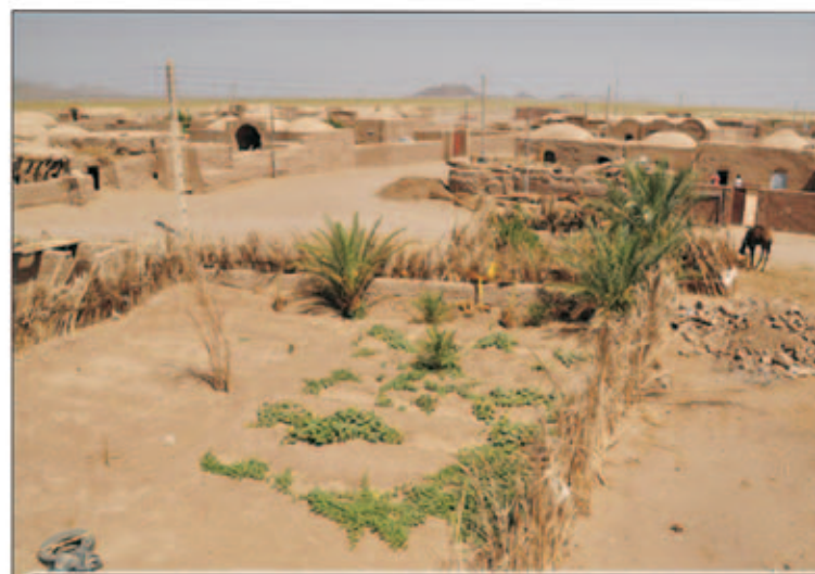
فقط ۶ میلیون روستایی کار دارند؛ کوچ بیکاری از شهرها به روستاها/۶

تشکیل شعبه رسیدگی به شکایات مردمی از موسسه میزان در دادستانی مشهد/۳ معاون برنامه ریزی و اشتغال استانداری خراسان جنوبی خبر داد