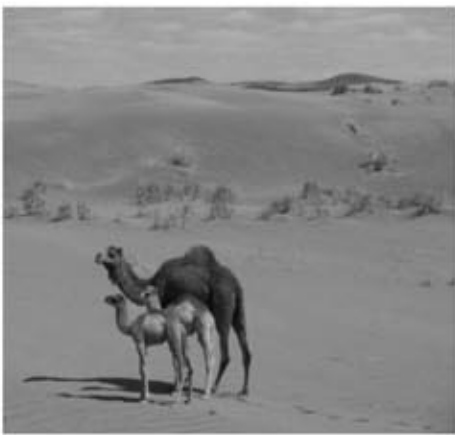
معاون گردشگری اداره کل میراث فرهنگی، صنایع دستی و گردشگری خراسان جنوبی از اختصاص بیش از ۵۰۵ میلیارد ریال اعتبار ملی به کمپ گردشگری دهسلم نهپندان در این استان خبر داد.