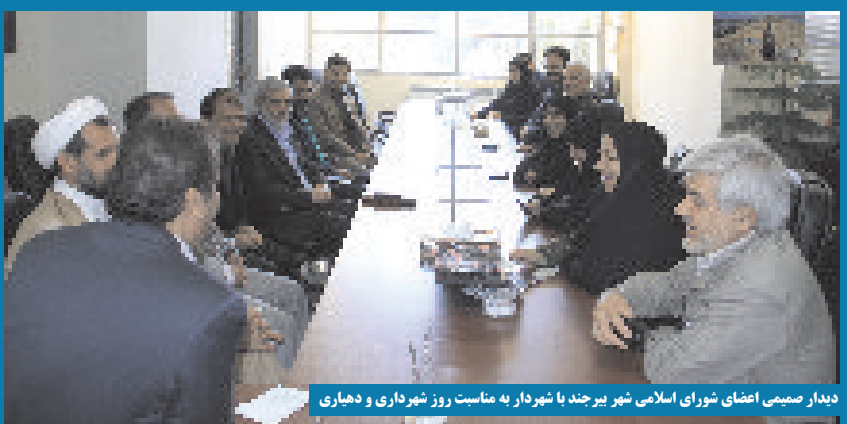
دیدار صمیمی اعضای شورای اسلامی شهر بیرجند با شهردار به مناسبت روز شهرداری و دهجاری